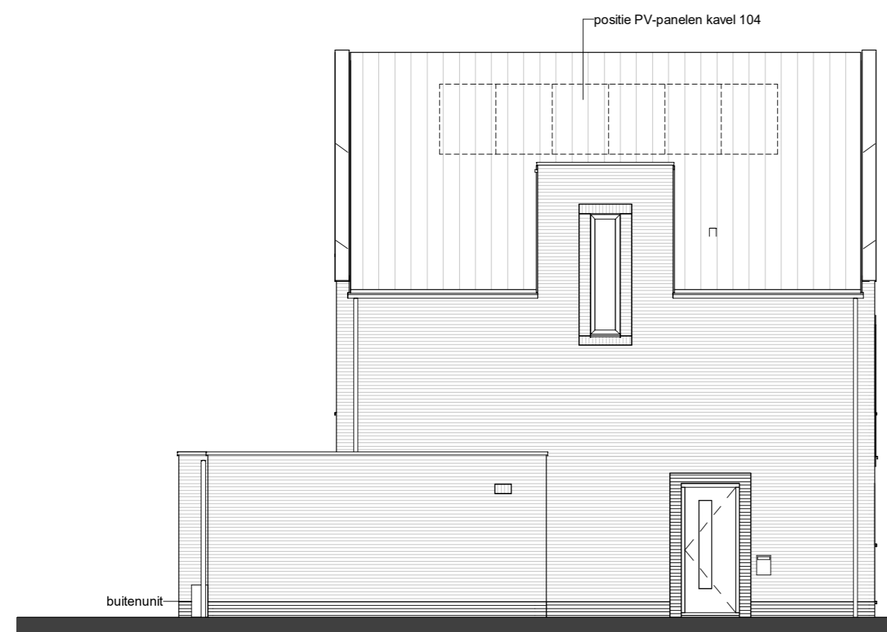
TYPE E1 kavel 82