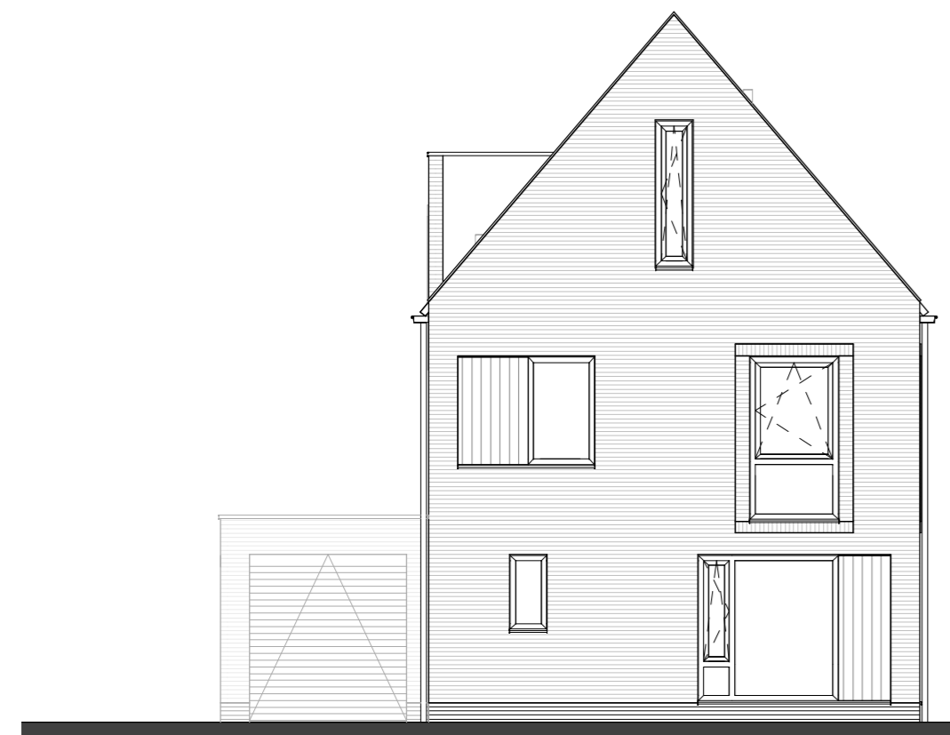
TYPE E1 kavel 82 KAVEL 82, 104 getekend KAVEL 105, 106 gespiegeld