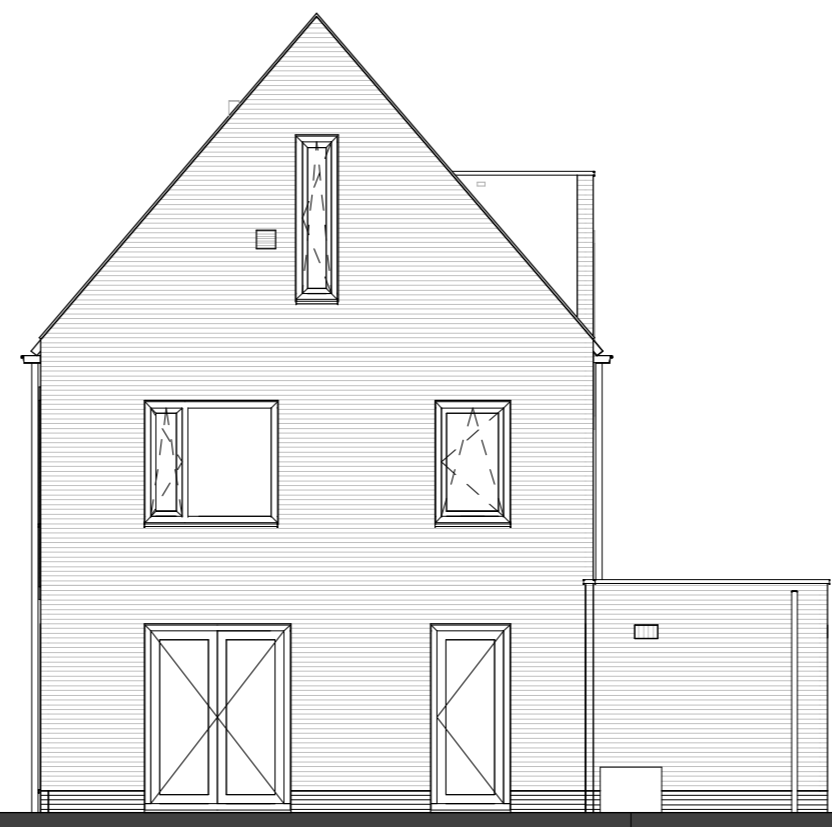
TYPE E1 kavel 82 KAVEL 82, 104 getekend KAVEL 105, 106 gespiegeld