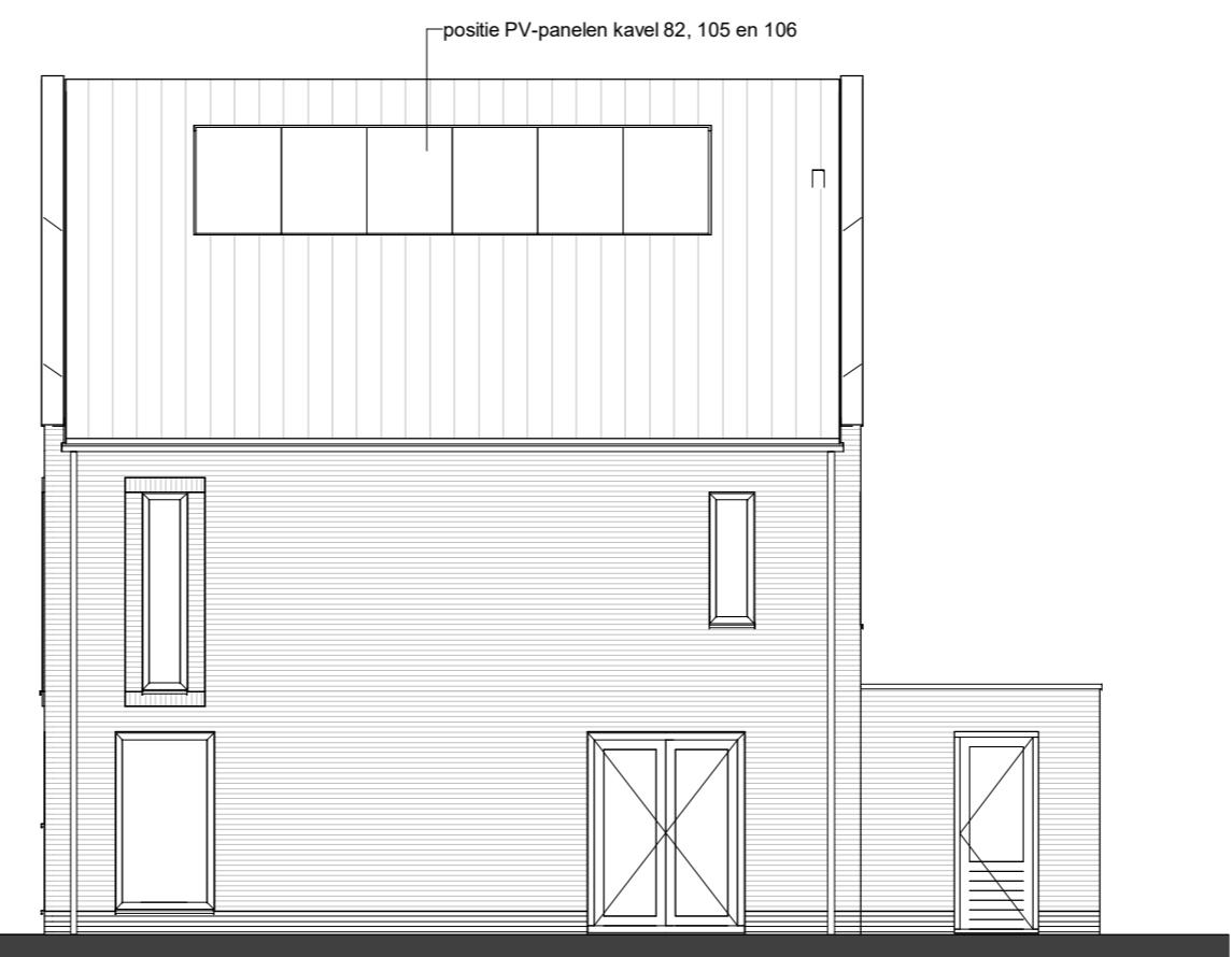
TYPE E1 kavel 82